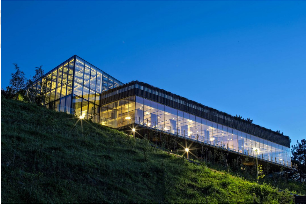
Restaurante Azurmendi 3 estrellas Michelin