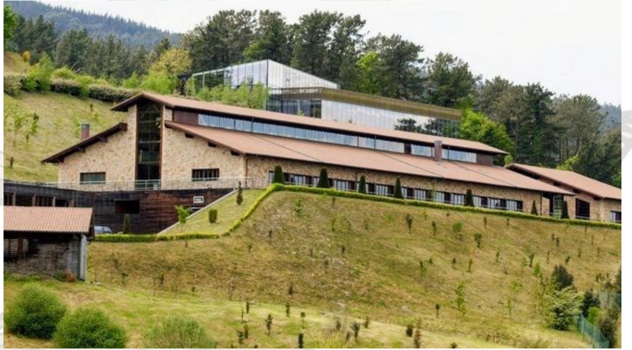
Restaurante Eneko 1 estrella Michelin